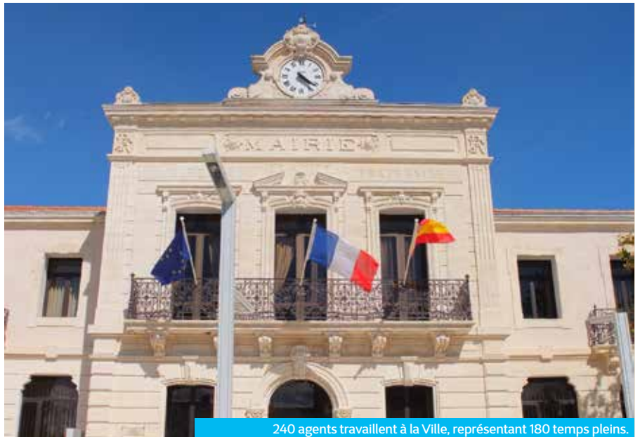
240 agents travaillent à la Ville, représentant 180 temps pleins.

C'est le nombre de pages du règlement intérieur adopté en conseil municipal. Un document complet qui permet de faciliter la compréhension par tous de ses droits et devoirs.