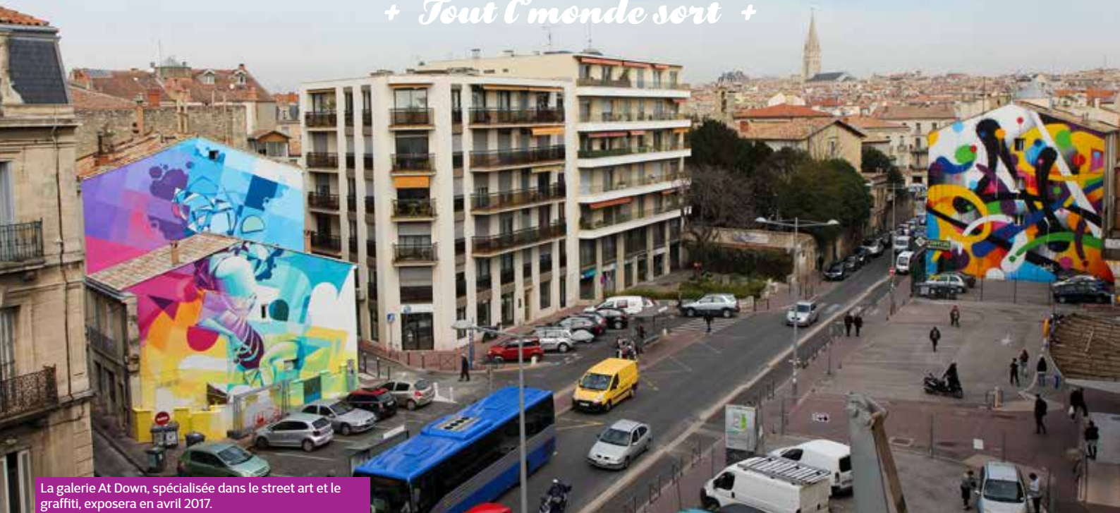
La galerie At Down, spécialisée dans le street art et le graffiti, exposera en avril 2017.