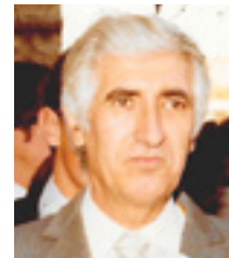
© Le Terral - Saint Jean de Védas

La Commune, par le biais de la nomination d'une nouvelle rue, a souhaité honorer sa mémoire et son oeuvre.