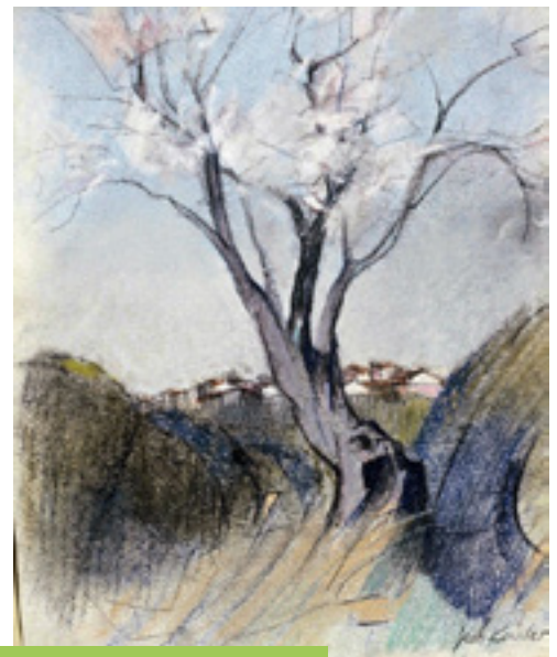
© Amandier - Saint Jean le Sec