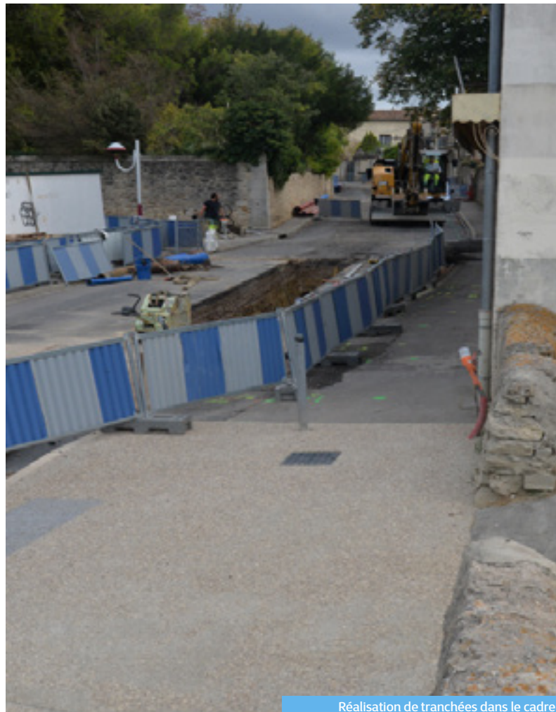
Réalisation de tranchées dans le cadre de la réhabilitation des réseaux

Vous pouvez suivre l'avancée des travaux et l'impact sur la circulation à l'aide de notre carte interactive.