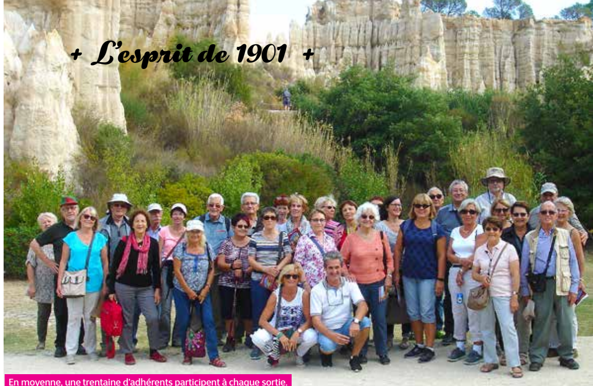
En moyenne, une trentaine d'adhérents participent à chaque sortie.

Depuis trente ans, l'association Obliques vous invite à (re)découvrir le patrimoine culturel, architectural, industriel... de notre région et d'ailleurs.