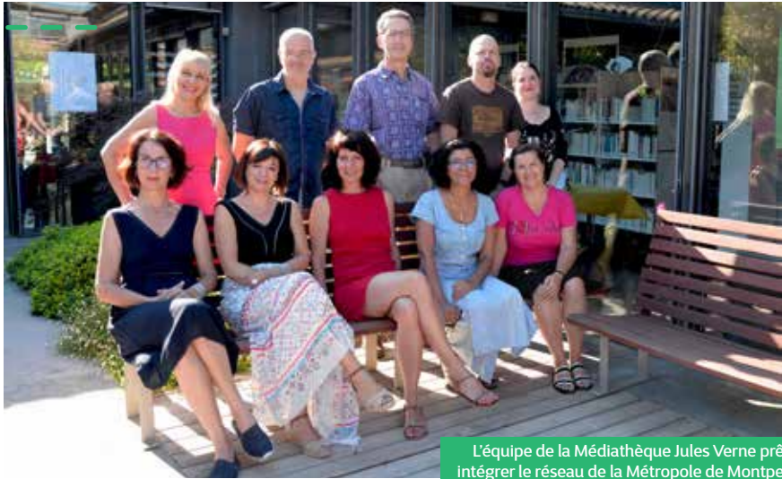
L'équipe de la Médiathèque Jules Verne prête à intégrer le réseau de la Métropole de Montpellier

A compter du mardi 3 juillet, les adhérents auront donc accès à tout le catalogue du réseau métropolitain : emprunt de 12 documents et accès à l'offre numérique (5 livres et 5 programmes vidéo à la demande par mois). Ils auront également la possibilité de restituer leurs documents dans toutes les médiathèques du réseau grâce aux boîtes retour. Pour les adhérents déjà inscrits, pas de changement. Par contre pour les nouveaux inscrits, les modalités seront modifiées pour être conformes aux pratiques de la Métropole, avec un tarif passant à 8 €.