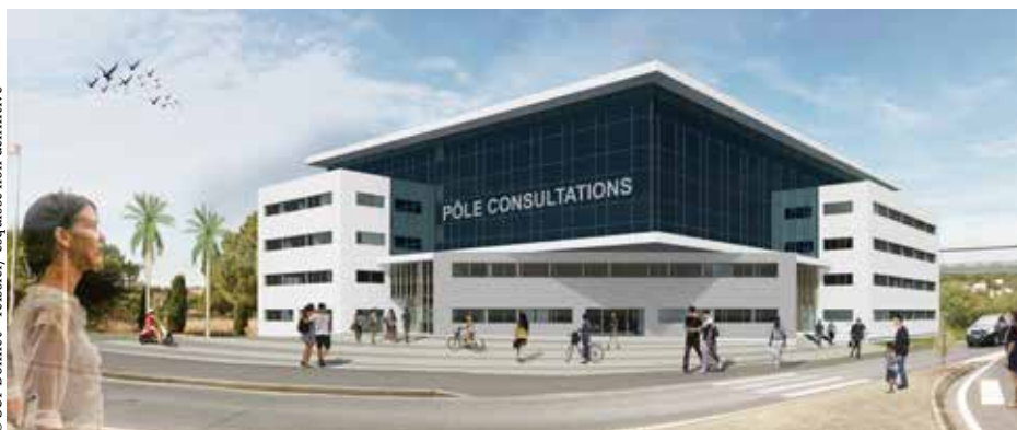
© SCP Bonnet - Teissier / esquisse non définitive

séparé de la chaussée par une large bande d'arbres et d'arbustes.