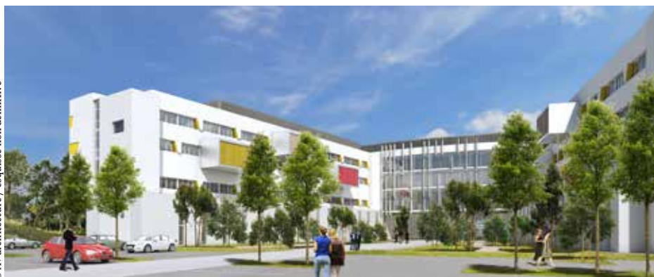
© A+ architecture / esquisse non définitive

Maintenant que tout est sur les rails, je suis heureuse pour l'ensemble des Védasiens qui vont bénéficier à court terme d'une offre de service prodigieuse en matière de santé.