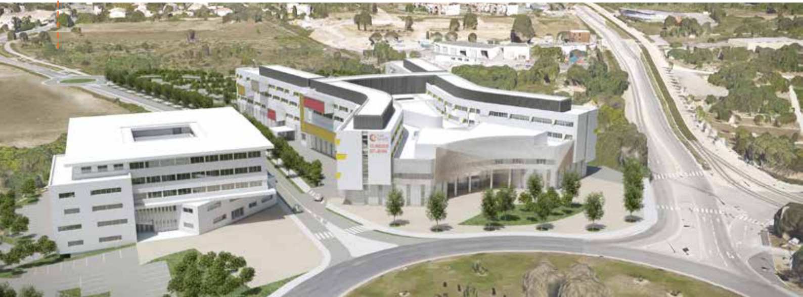
© A+ architecture / esquisse non définitive

Les vues d'implantation sont de plus en plus précises et pour cause : les permis de construire ont été déposés et les différents dossiers administratifs et techniques ont abouti favorablement... cette fois, on peut enfin dire que la clinique Saint Jean arrive !