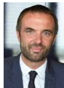
Michaël DELAFOSSE Maire de Montpellier Président de Montpellier Méditerranée Métropole