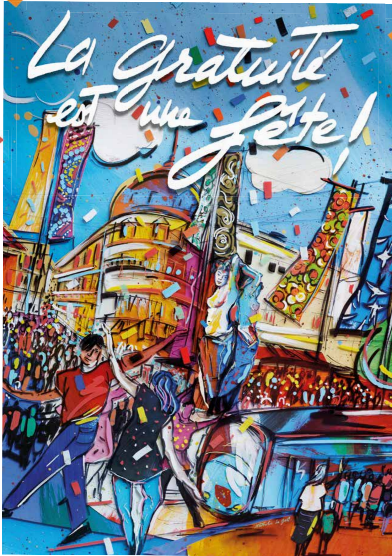
Illustration : Nathalie Le Gall

Montpellier Méditerranée Métropole - Direction de la Communication - 11/2023